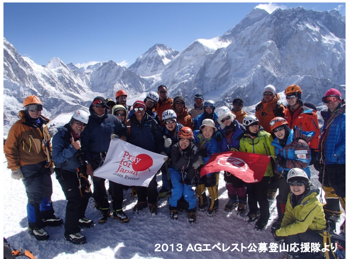
2013 AGエベレスト公募登山隊応援隊より

* 現地での日程は目安です。天候、ルート状況、参加者の高所順応の状況によって、予告なく変更される場合もございます。予めご了承下さい。